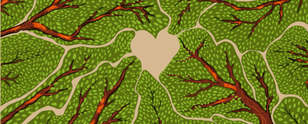
Ilustración: • Lynn Atieno for ArtistsForClimate.orgs

El 25 de mayo se celebra el Día de África. Esta fecha conmemora la fundación de la Organización para la Unidad Africana en el año 1963 para promover la solidaridad de los estados africanos, acabar con el colonialismo y fomentar la cooperación internacional. Actualmente, el Día de África es festivo en todos los países del continente africano y recoge actos en el resto del mundo.