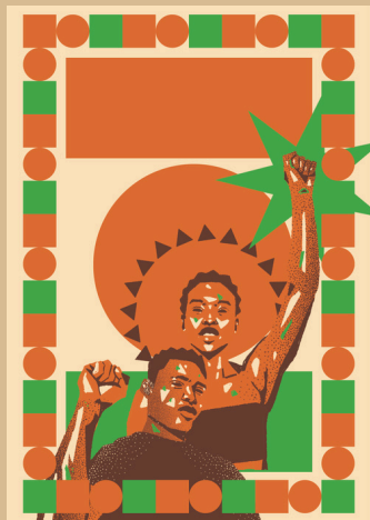
Ilustración: • Kael Abello

Sábado 23 de mayo - 19h / El Calendoscopio