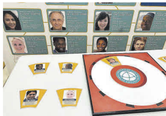
Un detalle del juego de Escape Room del Foro Solidario.

Las actividades del Foro Solidario continúan hoy en la Casa de Cultura, con las primeras representaciones de la función “CC”, dirigidas a alumnado de 5.º y 6.º de Primaria. La obra pretende sensibilizar en la responsabilidad de proteger el medio ambiente y ante el cambio climático. En el palacio de Valdecarzana tendrá lugar un encuentro-diálogo sobre experiencias “para enfriar el planeta”. En el centro de mayores de Las Meanas continúa abierto el Escape Room sobre Objetivos de Desarrollo del Milenio (en la foto).